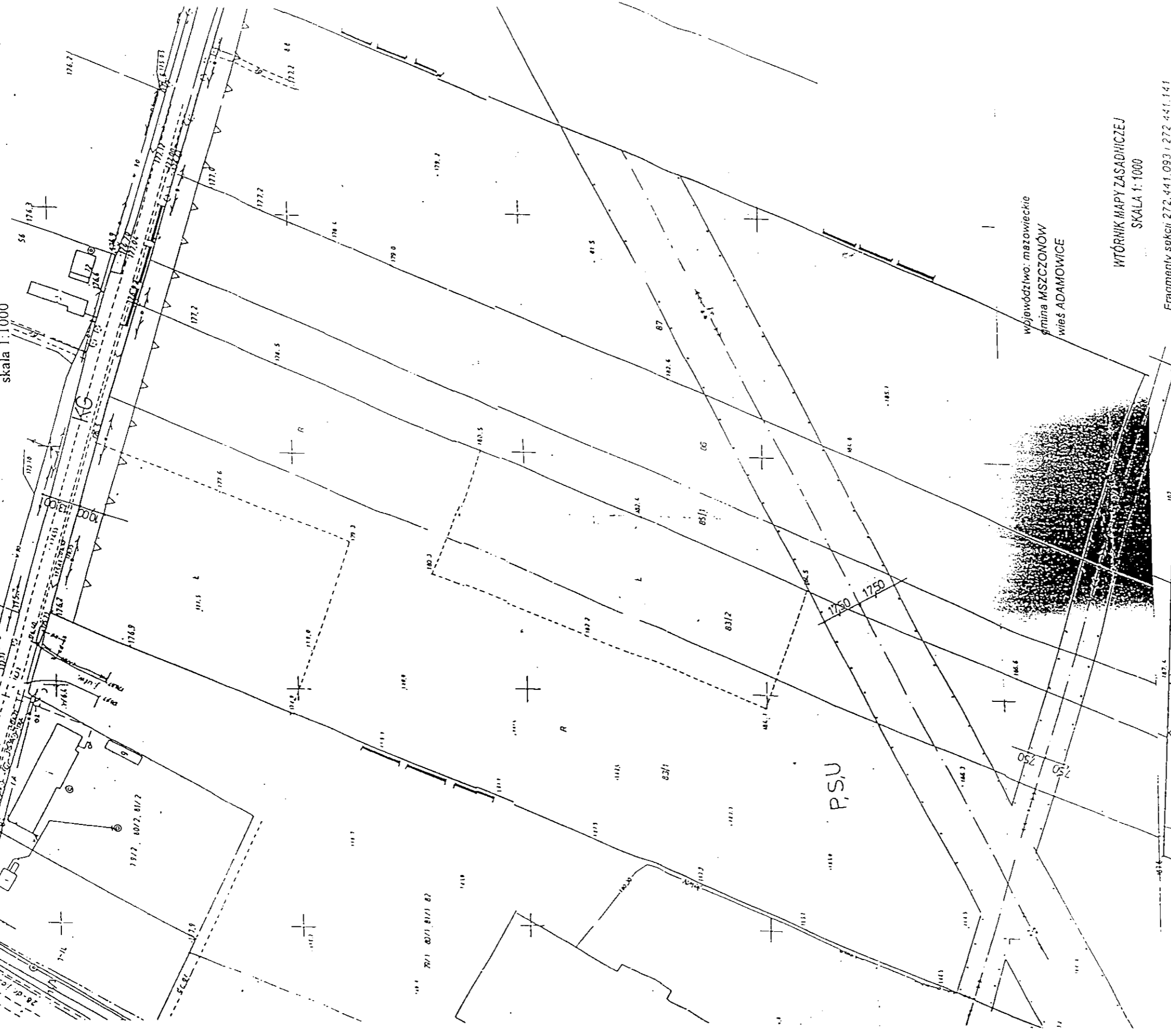
WTÓRNIK MAPY ZASADNICZEJ SKALA 1:1000

wieś Adamowice dz. nr ew. 83/1, 83/2, 85/1, 86, 87, 88 skala 1:1000